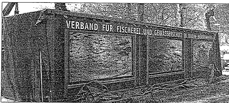
Einblicke in die Welt der Flussfische: Das Aquarium ist landauf landab ein Publikumsmagnet.

Neben dem Aquarium werden über die Woche mehrere Experten vom Fischereiverein Horb mit einem Informationsstand bereit stehen und die Besucher über die Fischerei aufklären. Möglich macht diese Projekt der Regierungsbezirk Karlsruhe, der das Vorhaben etwas bezuschusst und somit dem Fischereiverein Horb etwas unter die Arme greift.